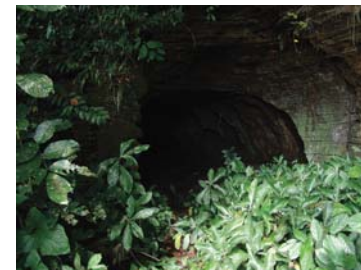
Entrée de la grotte de Malébé à Lébamba