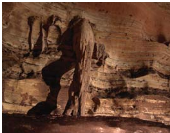
Pilier stalagmitique dans la grotte de Lihouma à Lastoursville