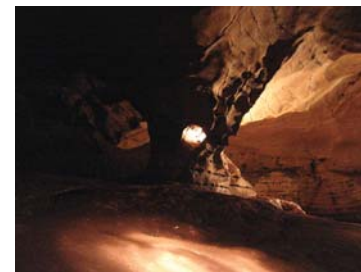
Pilier troué dans la grotte de Malébé à Lébamba