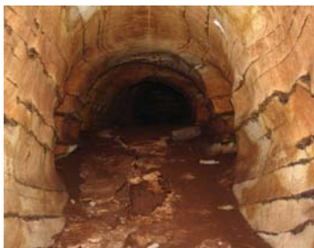
Galerie de la grotte de Bongolo à Lébamba